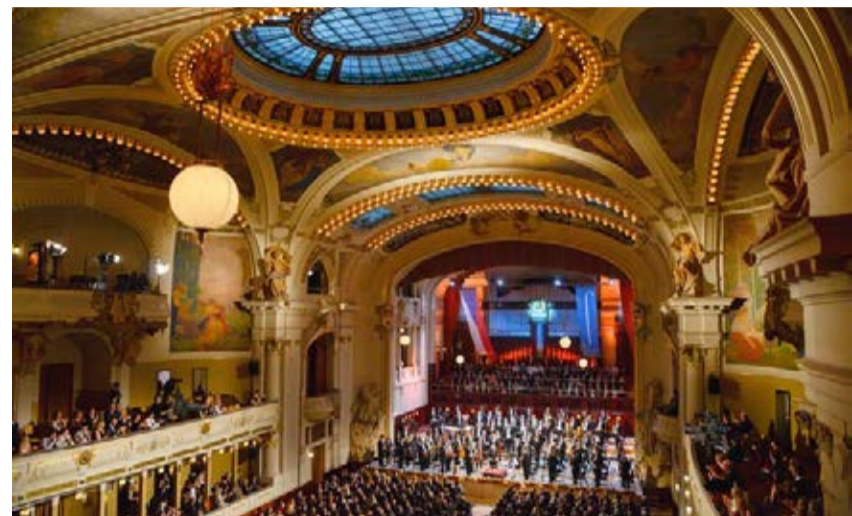
Zahajovací koncert: D. Barenboim, Wiener Philharmoniker (12. 5. 2017)

Jeden z nejstarších a nejprestižnějších hudebních festivalů v Evropě, Pražské jaro, poprvé od svého vzniku v roce 1946 prožívá zásah vyšší moci. Dlouho a složitě předem vyjednávané koncerty zahraničních orchestrů a světových sólistů se nemožno uskutečnit. Organizátoři ale před pandemií nekapitulovali a rozhodli se letošní speciální ročník přesto uskutečnit v podobě 11 koncertů, které budou živě přenášeny z pódíí pěti pražských koncertních sálů a jedné brněnské.