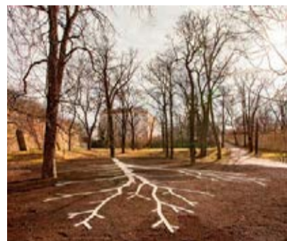
Pomník Maxe van der Stoela, Dominik Lang, Jakub Červenka a kol., foto © Pavel Matela

V úvodu výstava nabízí přehled zdokumentovaných míst podle městských částí. Stačí si jen vybrat, co nás konkrétně zajímá. Ještě jste nebyli na Bastionu u Božích muk (Praha 3)? Neznáte to v Parku Podvíní (Praha 9)? Zajímá vás, jak si architekti poradili s řešením velkých staveb z pohledu začlenění do městské krajiny a úpravou ploch kolem nich? V přehledu najdeme řešení Anděl City nebo centrály ČSOB (Praha 5). Jsou tu i zajímavé tipy na malý výlet za Pra-